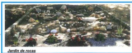
Jardín de rocas

El objetivo principal es educativo y no la mera producción de alimentos, por ello hemos adaptado el huerto al calendario escolar y a nuestros objetivos didácticos por encima del criterio de la máxima producción, sin por ello renunciar a tener una cosecha decente, claro está.